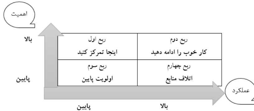
نمودار (۱) نواحی چهارگانه ماتریس اهمیت - عملکرد (آذر و همکاران، ۱۳۹۷)

نمودار (۱) نواحی چهارگانه ماتریس اهمیت - عملکرد را که شاخص‌های مورد مطالعه بر اساس مقایسه امتیازهای اهمیت با ارزش آستانه اهمیت و نیز مقایسه امتیازهای عملکرد با ارزش آستانه عملکرد در یکی از این چهار ناحیه قرار می‌گیرند را نشان می‌دهد: